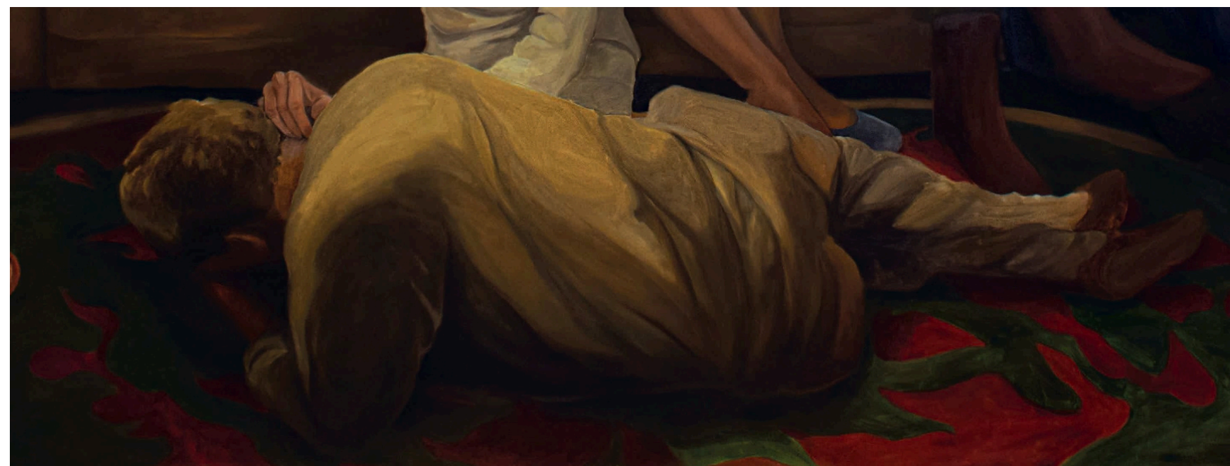
"Sin título" 2026 180 x 280 cm Óleo sobre tela