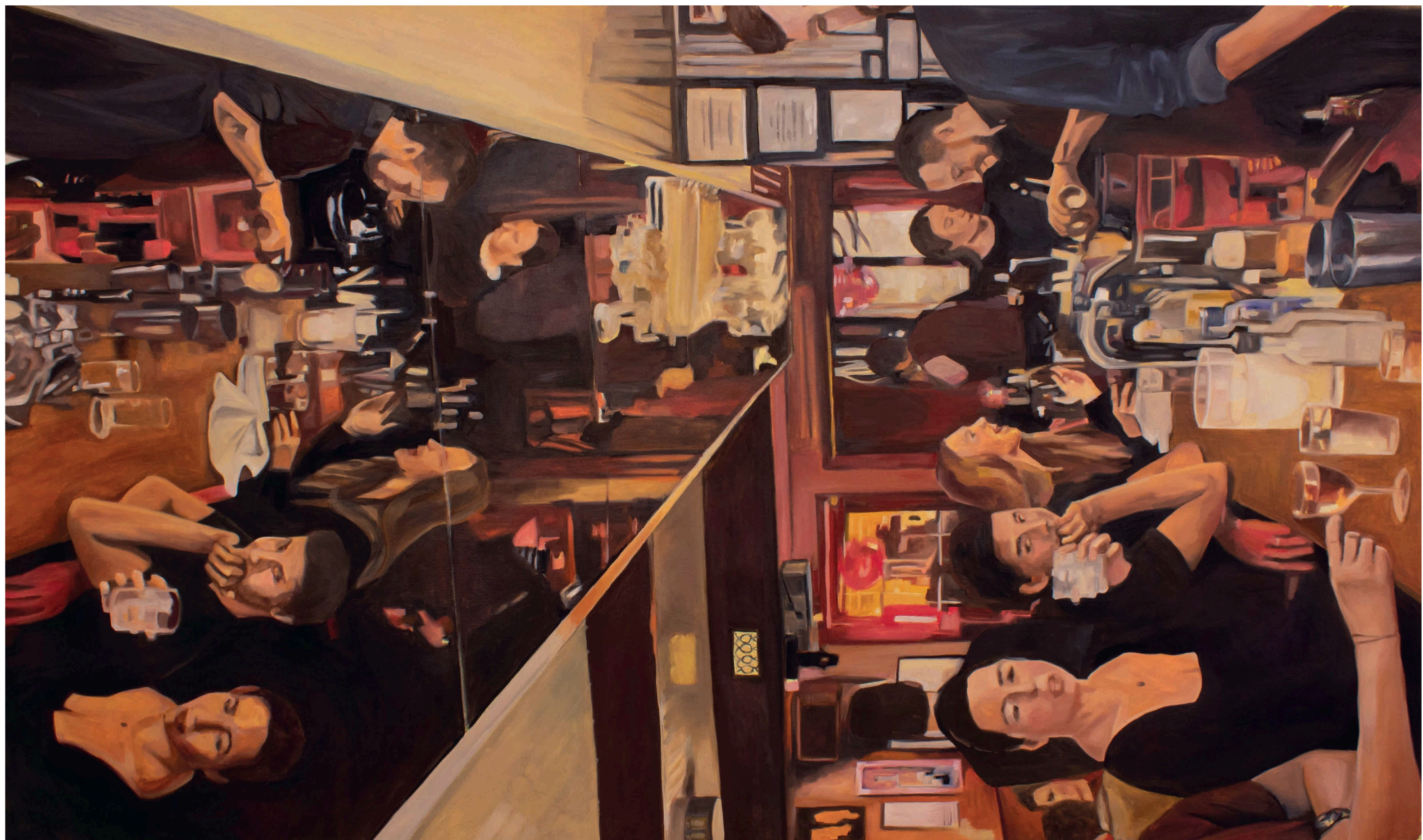
"Sin título" 2026 100 x 160 cm Óleo sobre tela