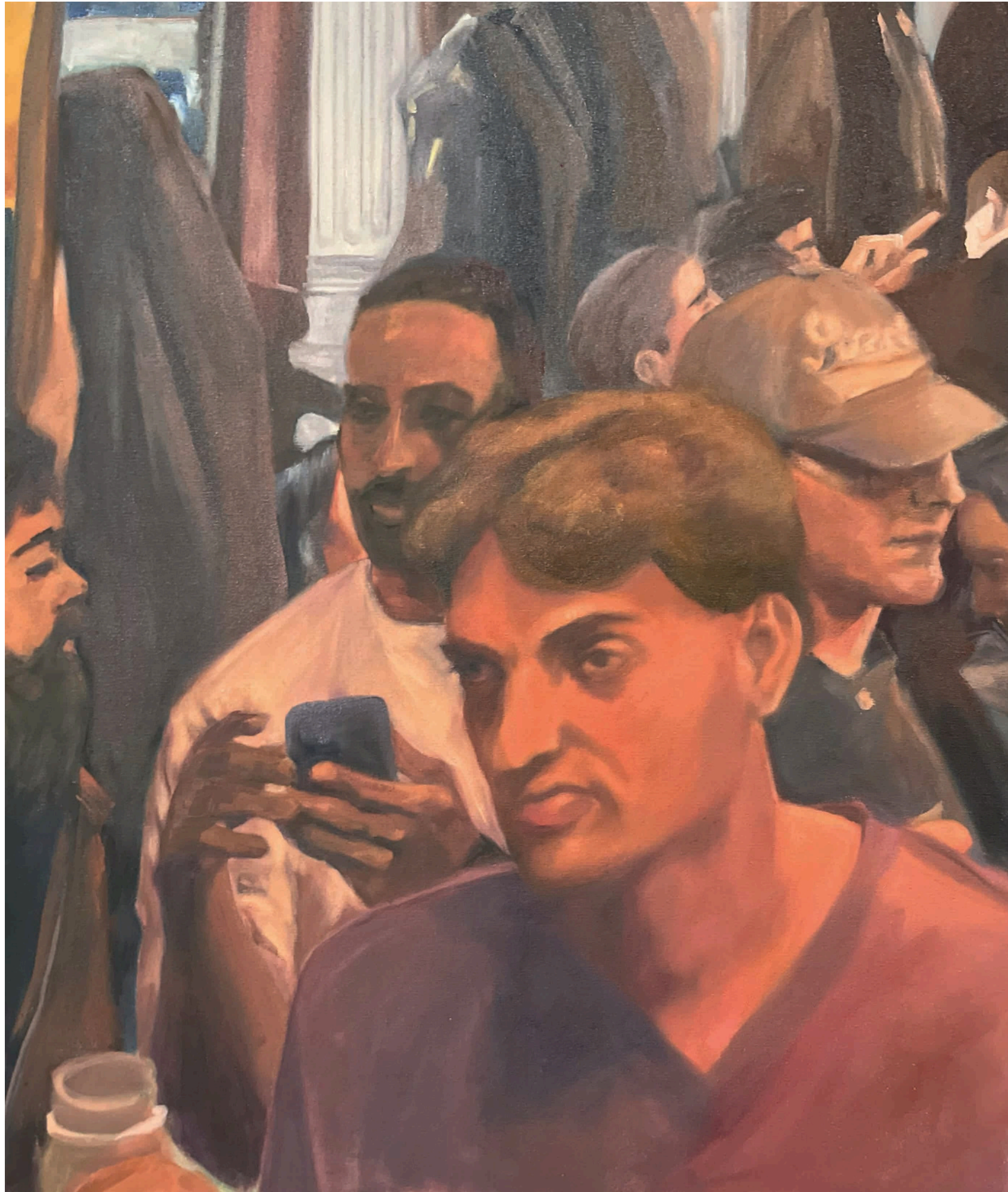
"Sin título" 2026 50 x 40 cm Óleo sobre tela