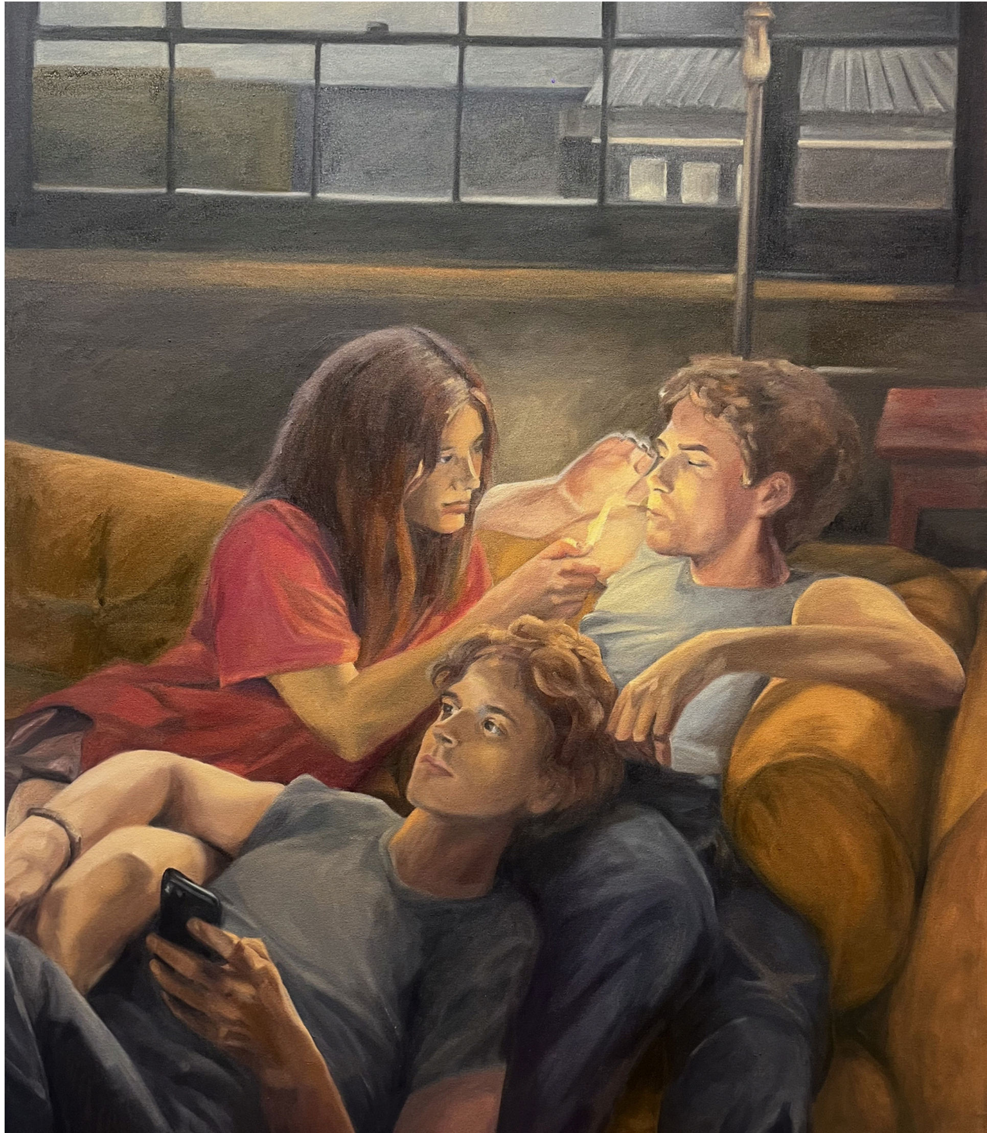
"Sin título" 2026 120 x 90 cm Óleo sobre tela