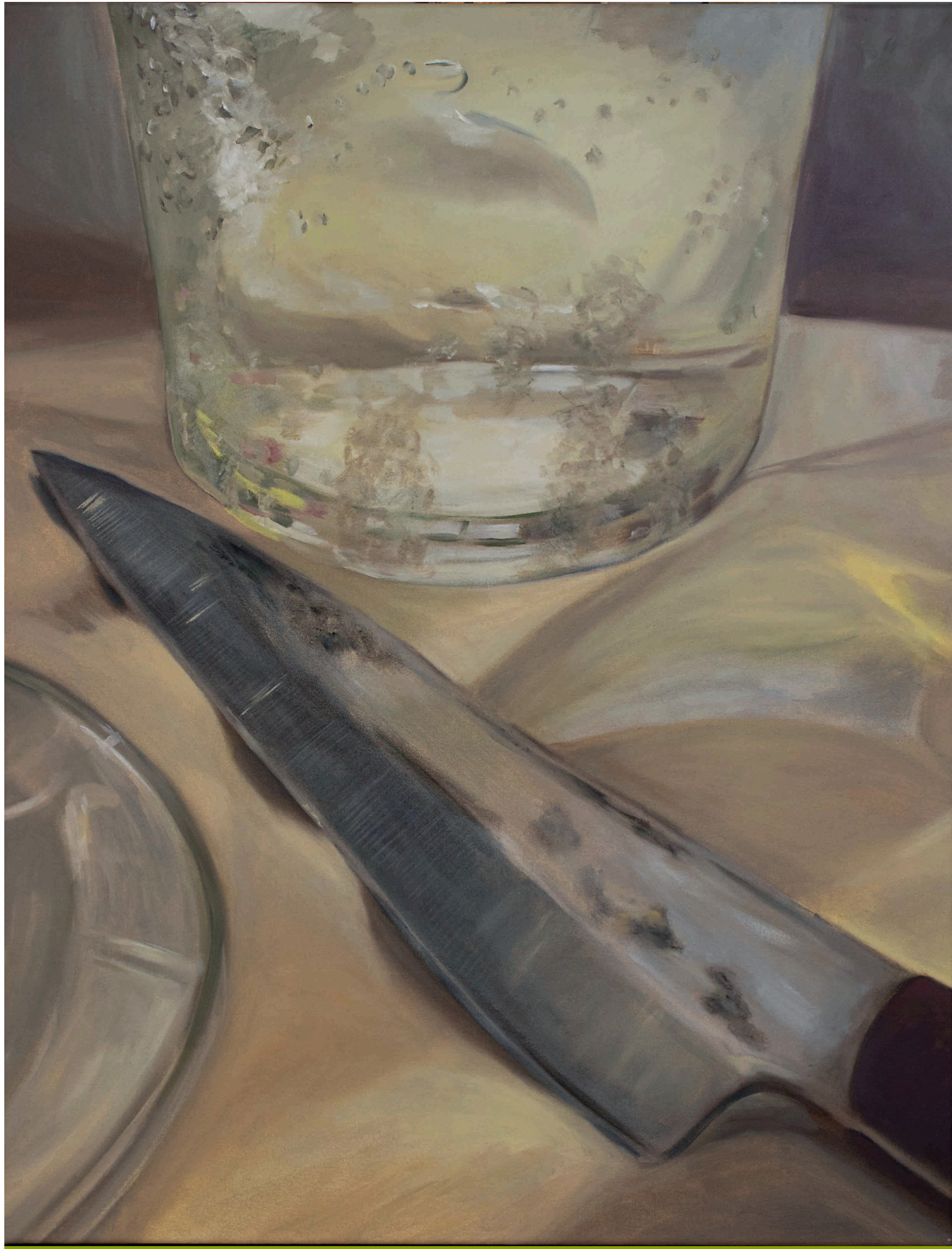
"Sin título" 2026 70 x 55 cm Óleo sobre tela