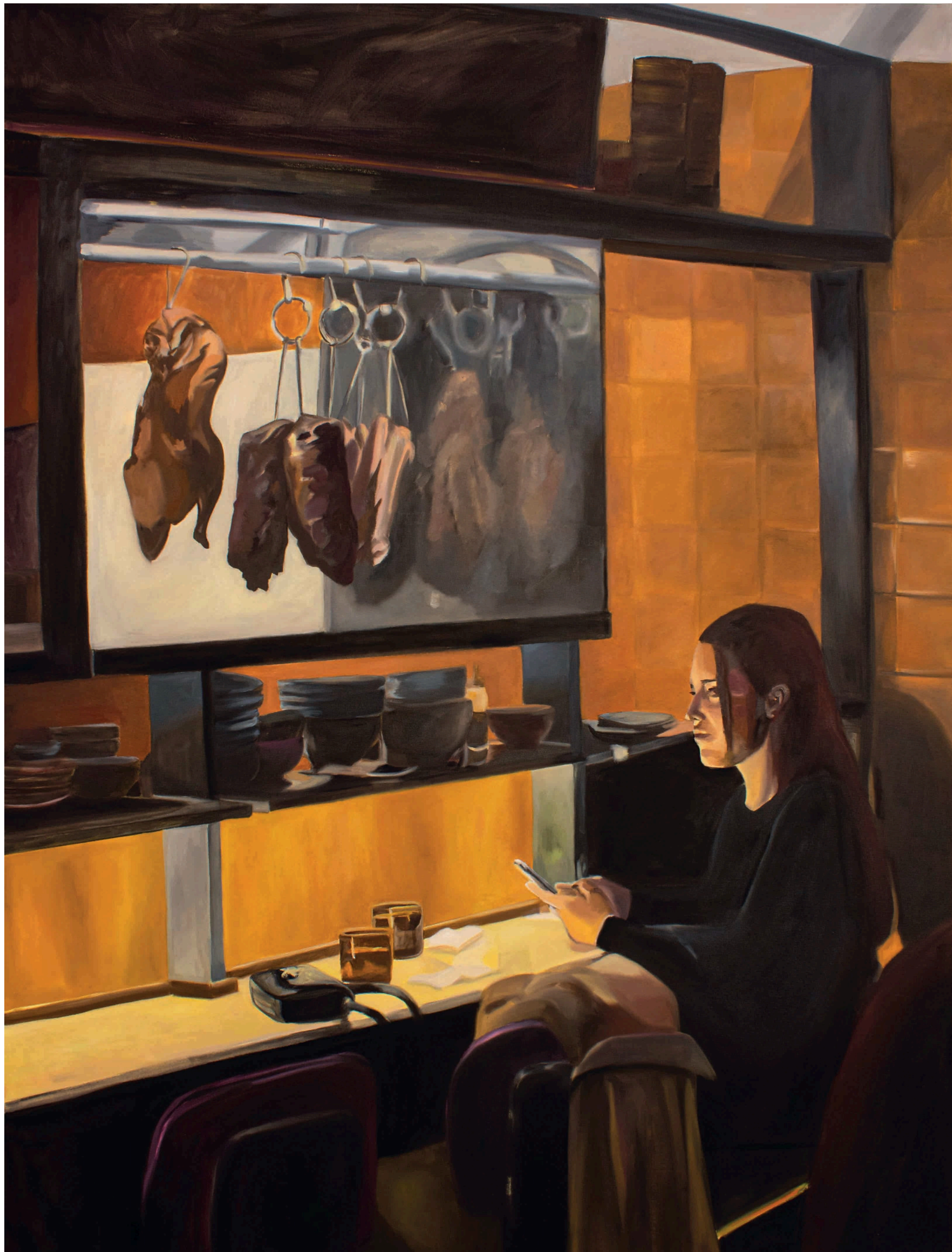
"Carne" 2026 160 x 120 cm Óleo sobre tela