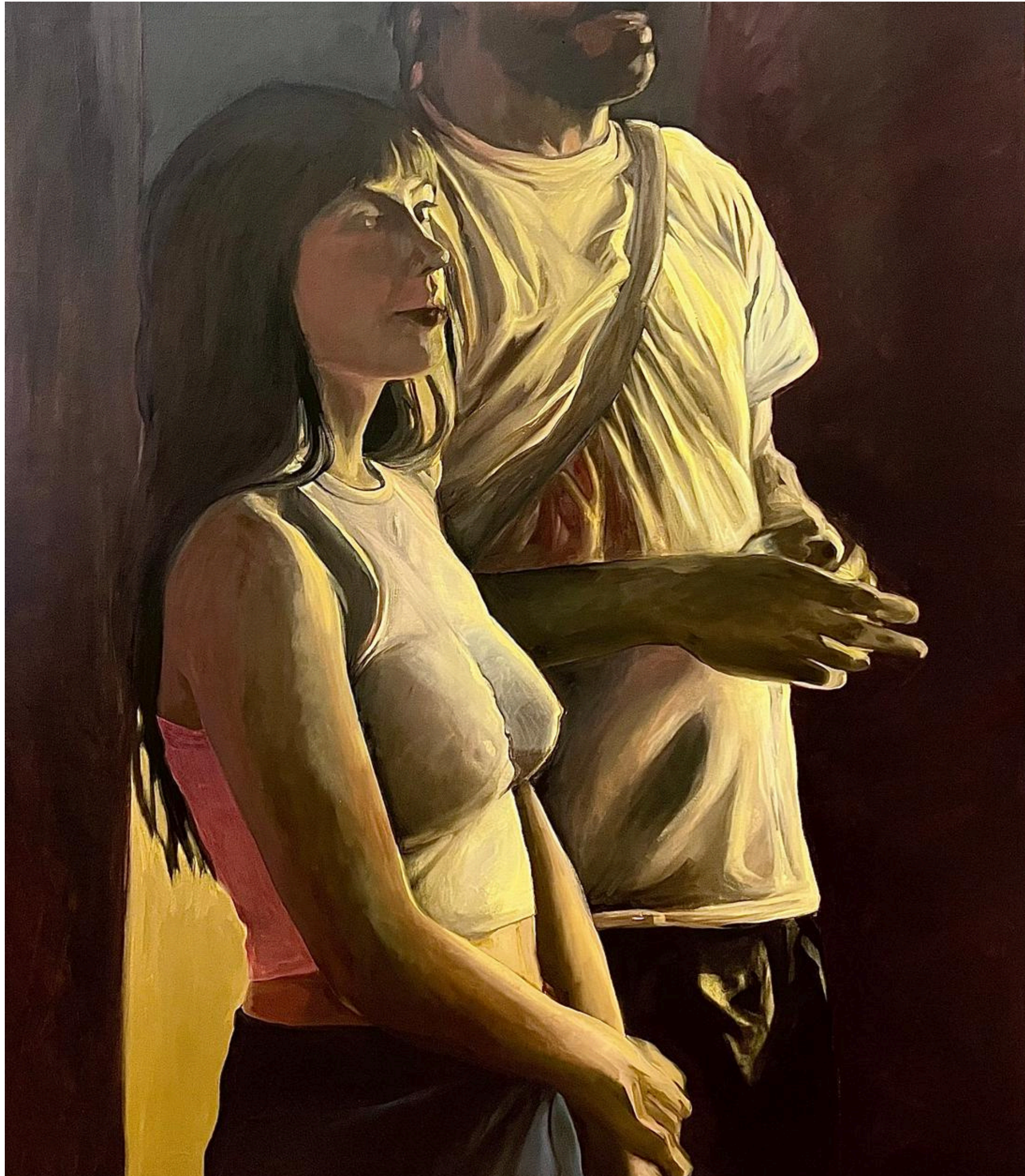
"Sin título" 2026 100 x 87 cm Óleo sobre tela