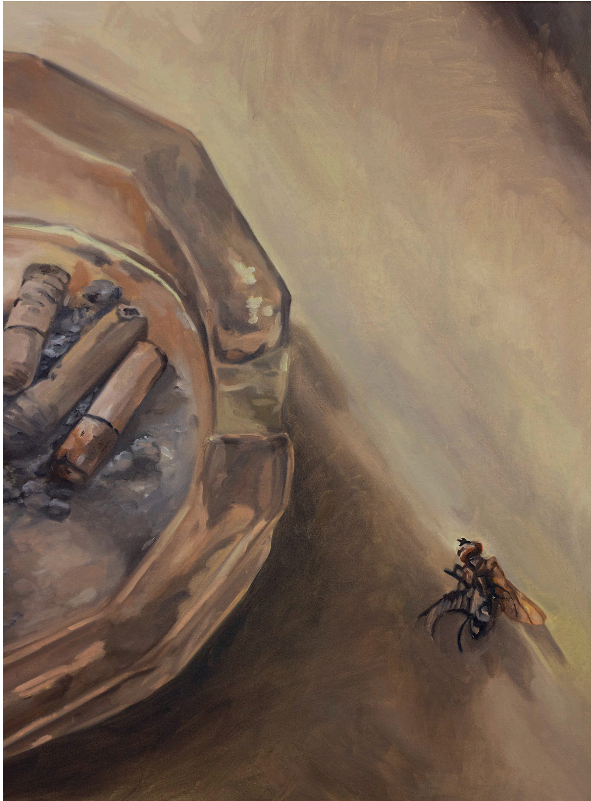
"Sin título" 2026 70 x 55 cm Óleo sobre tela